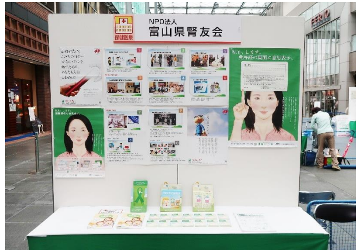
腎友会の展示ブース

腎友会や臓器移植のことを一人でも多くの方に知っていただくための活動を今後も継続していきます。