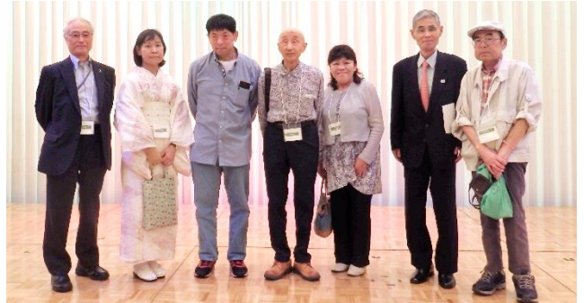
富山からの参加者

7月7日(日)、レンブラントホテル大分において開催された大会には、全国から700名以上の参加者があり、本会からは7名が参加しました。来年は福島県(郡山市)で開催されます。