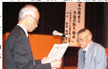
長期透析者表彰(35 年)

午前の大会では、主催者ならびに来賓挨拶の後、長期透析者表彰が行われ、40 年 4 名、35 年 6 名、30 年 10 名など合計 130 名が表彰され、当日出席された透析 30 年以上の皆さん