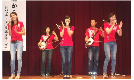
シバッチーズの皆さん