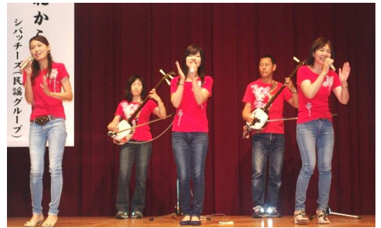
シバッチーズの皆さん