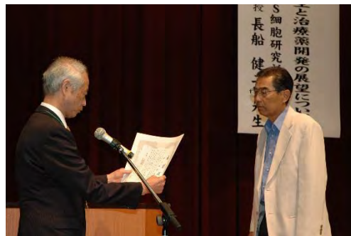
長期透析者表彰(35年)